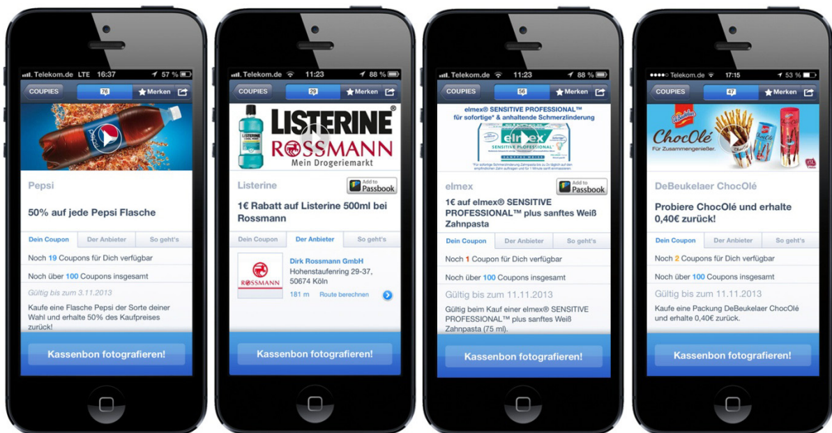
Video-Einbindung bei COUPIES Cashback-Coupons-Kampagnen

Im Jahr 2012 haben Videos bereits satte 51 Prozent des mobilen Datenverkehrs ausgemacht, für 2017 werden 66 Prozent vorhergesagt. Bei den Kernnutzern der YouTube-Plattform, stieg der Konsum mobiler Videos sogar um 74 Prozent. Im Marketing-Mix liegt der Anteil des Videogiganten allerdings nur bei sechs Prozent, sodass ein großer Teil des Potentials bisher ungenutzt bleibt.